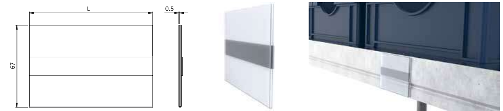
Magnetic Label Holder 67 - 2.64" Magnetischer Einsteckträger 67