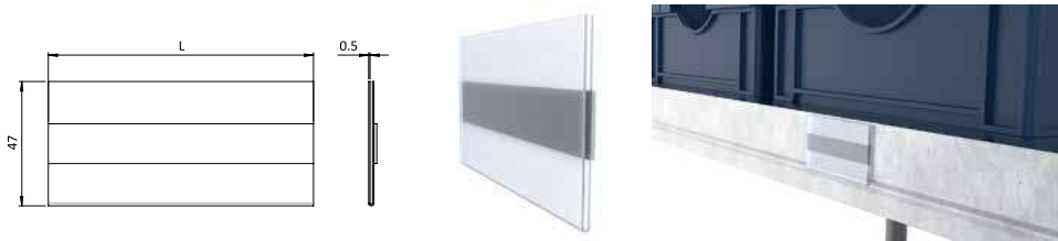
Magnetic Label Holder 47 - 1.85" Magnetischer Einsteckträger 47